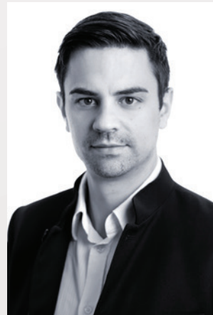
Dr. Thomas Nikodem LL.M. D.A.S. Partneranwalt www.telos-law.com

Neben den Problemen, die im Zusammenhang mit einer Videoüberwachung auftreten können, ist wesentlich, ob sie als Beweismittel in Gerichtsverfahren über Nachbarschaftsstreitigkeiten verwendet werden dürfen oder ob ein Beweisverbot besteht. Ein Beweisverbot existiert im Zivilverfahren grundsätzlich nicht. Ist jemand im Besitz einer Videoaufnahme, kann er diese auch als Beweis verwenden. Dies gilt selbst dann, wenn sie rechtswidrig erstellt wurde. Zu beachten ist aber, dass im Fall der Verwendung die oben genannten straf- und zivilrechtlichen Maßnahmen eingeleitet werden können. Im Zusammenhang mit Videoüberwachungen weisen wir daher darauf hin, dass unbedingt behutsam vorgegangen und deren Zulässigkeit vorab geprüft werden muss, um spätere rechtliche Konsequenzen zu vermeiden.