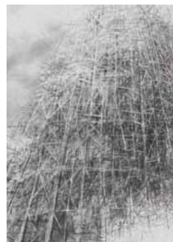
Karl Heigel, Babylonischer Turmbau, Graphit, 2014, 70 x 100 cm

Im nächsten Jahr wird diese hoffentlich ebenfalls unendliche Geschichte u. a. mit dem „Kunstprisma Lilienfeld“ ( www.kunstprisma.at ) fortgesetzt. ■