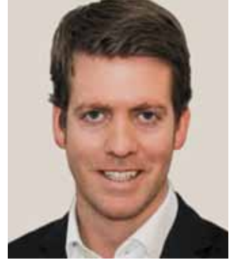
Riel Grohmann Rechtsanwälte in Krems